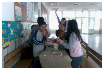
- bárány tojástartó kialakítása wc papír gurigából