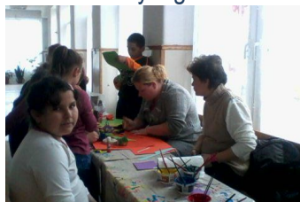
- Húsvét témájú gipszfigurák festése

„Húsvéti játszóház” kézműves programjához csatlakoztunk 14:00 órától-16:00 óráig. A tevékenységek témában kapcsolódtak az ünnephez: