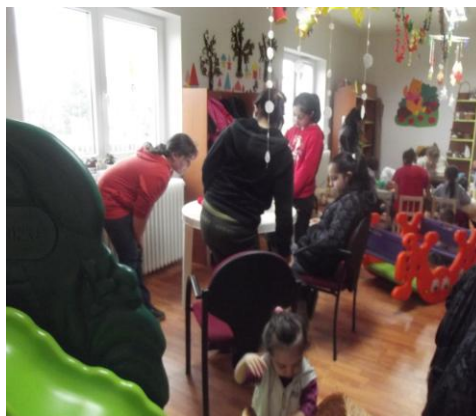
Hóember bábkészítés wc papírgurigából, körlapokból és csíkokra vágott papírból.

A szülők segítettek a kicsiknek a kívánt tárgy megalkotásában.