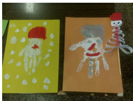
Hóember festés tenyérrel.

Kisebb, nagyobb körök kivágásával a hóemberünk is elkészült, igaz csak kép formájában. Tenyérfestéssel, és lenyomatból alakították ki a gyerekek szintén a hóemberes a figurákat.